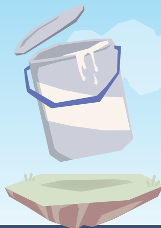
Puszka białej farby