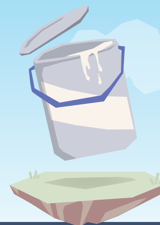
Puszka białej farby

W środę PETrynio na prośbę Wujka PETryka pojechał rowerem do sklepu budowlanego i kupił dwie nowe puszki białej farby do drewna. Po drodze oddął starą puszkę do utylizacji w PSZOK-u.